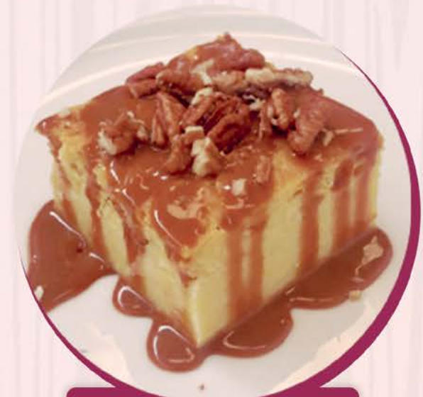
PAN DE ELOTE

SUCURSAL LINCOLN | CONTRY | UNIVERSIDAD | VALLE